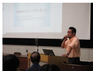
ロックエンジニアリング(株)