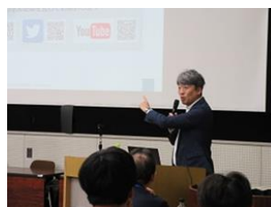
(株)山本金属製作所